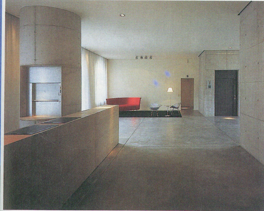
Une rénovation pensée dans un esprit minimaliste. Dans ces anciennes brasseries de Schaerbeek, des ponts suspendus relient les différents plateaux (ci-dessous).