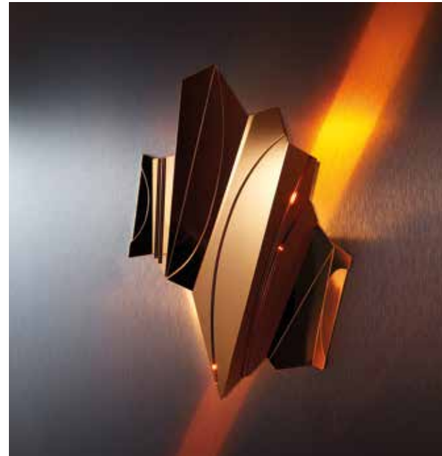
MYDRIAZ, Cross Bitume