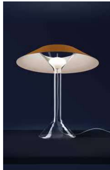
FOSCARINI, Chapeaux, design by Rodolfo Dordoni foscarini.com