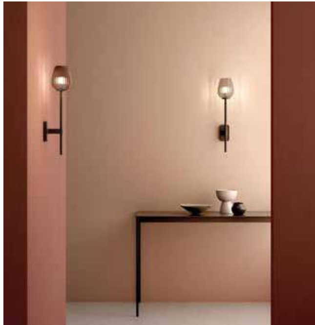
ASTRO LIGHTING, Tacoma Glass - astrolighting.com