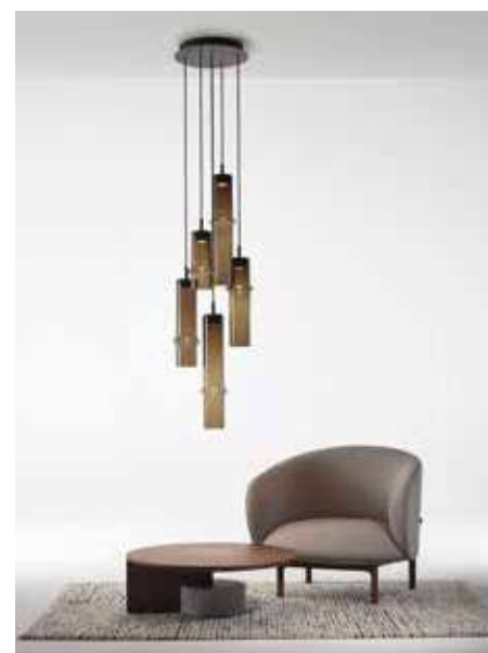
BROKIS, Bamboo Forest, design by Fumie Shibata

Des créations durables, issues de l'artisanat technologique, combinent fabrication à la main, savoir-faire locaux et industrie. Des pierres naturelles mexicaines composées de minéraux, verre, débris et poussières volcaniques s'associent à l'aluminium. Un tissage innovant de fils lumineux intégrés à des lumières LED, formant un textile tubulaire en polyester recyclé, enfilé sur une tige, compose une structure modulaire aérienne. Chaque composant éclairant de l'abat-jour est démontable en vue d'éventuelles réparations, tandis que l'ensemble de la lampe peut être démonté pour le recyclage.