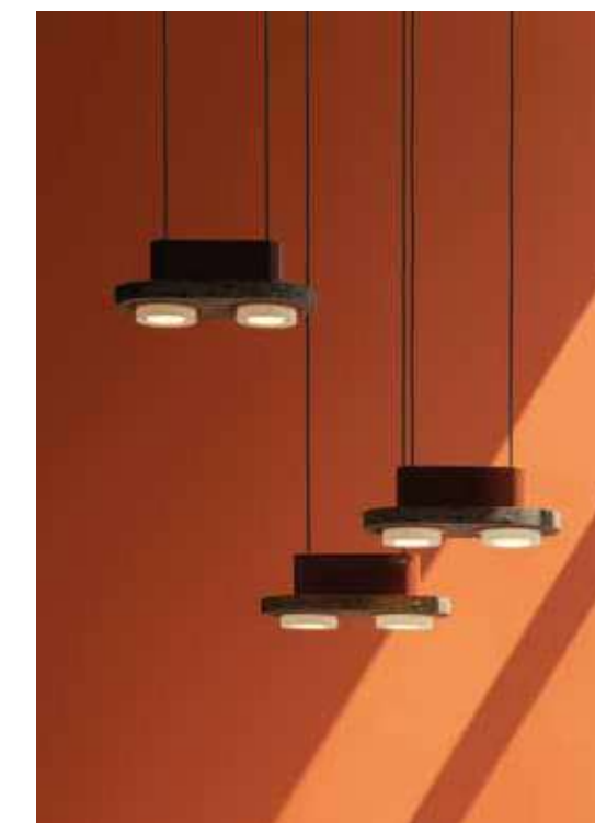
STUDIO DAVID POMPA, Ambra Toba - davidpompa.com

Sustainable creations, born out of technological craftsmanship, draw on a combination of handicrafts, local know-how and industrial techniques. Natural Mexican stones made from minerals, glass, debris and volcanic dust are cleverly partnered with aluminium. An innovative weave of luminous threads with integrated LED lights, forming a tubular textile in recycled polyester, is threaded onto a rod to fashion an aerial modular structure. Each lighting component of the lampshade can be dismantled for repairs, while the whole lamp can be taken apart for recycling at the end of its life. ▶