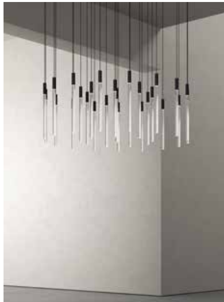
KARAKTER, Plexi, design by Angelo Magiarotti karakter-copenhagen.com