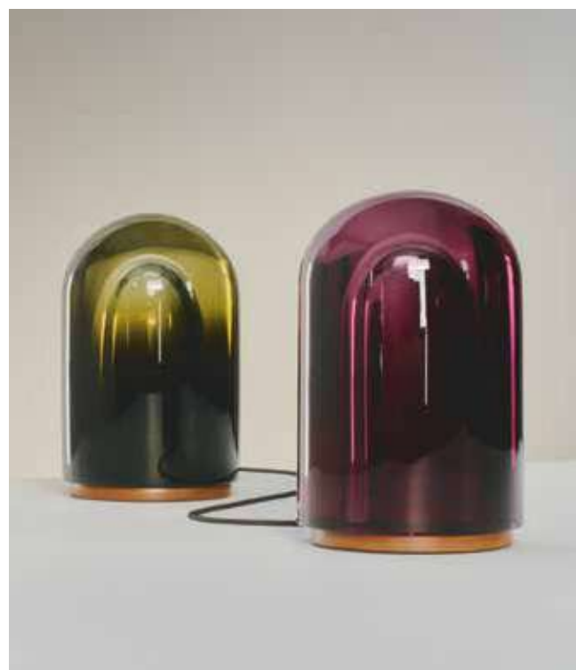
HERMÈS, Souffle d'Hermès, design by Harri Koskinen © Maxime Tetar hermes.com

The circle, which can be traced back to the imperfection of the calligrapher's gentle, spontaneous gesture, evokes illumination and plenitude. Whether a ball of molten glass on a steel cone or a hat-shaped diffuser on a Pyrex glass support, these table lamps exude a sense of elegance. The light they diffuse is extended by and reflected on their bases while the lampshades merge with their supports to form a single monolithic object. □