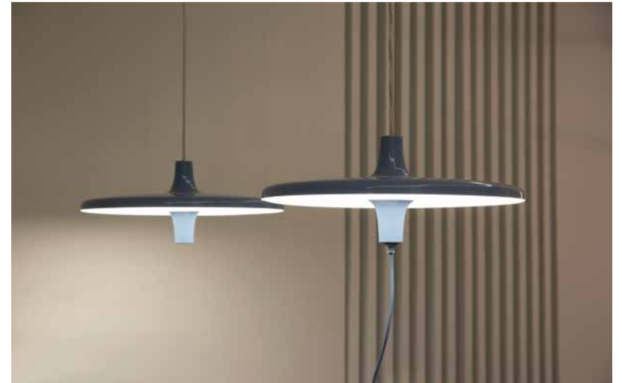
MARTINELLI LUCE, Avro, design by Studio Natural - martinelliluce.it