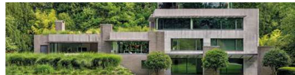
Green immersion Brussels, Belgium