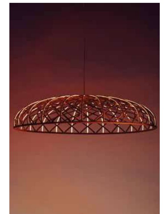
FLOS, Skyneest, design by Marcel Wanders - flos.com