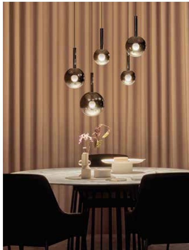
OCCHIO, Luna, design by Elisha Bachoa - occhio.com

A whole bunch of bulbs, inserted into brass discs, positively oozing a nostalgic charm. A patented "Fire Ball" light source floats in a shiny glass diffuser, making it possible to obtain a glare-free light. It is available as a ceiling, hanging, wall or table lamp. An ethereal cascade of translucent, iridescent bubbles brings back memories of childhood. Whatever the inspiration behind the object, it most definitely works its magic! ▷