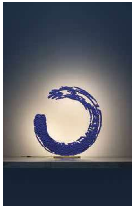
CATELLANI & SMITH, Ensō, design by Enzo Catellani © Nava Rapacchietta - catellanismith.com