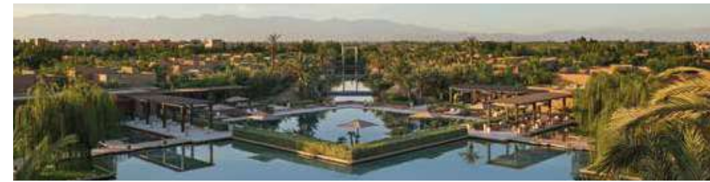
Confidential palace Marrakesh, Morocco