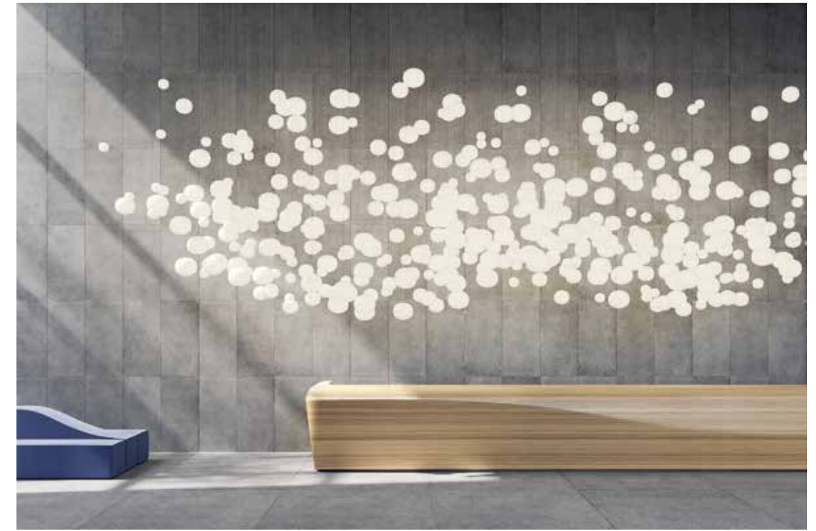
LODES, Volum design by Snøhetta - lodes.com