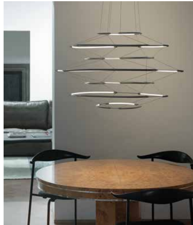
NEMOLIGHTING, Drop 9, design by Arihiro Miyake © Alberto Strada - nemolighting.com