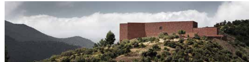
Red fortress Ourika valley, Marrakesh, Morocco