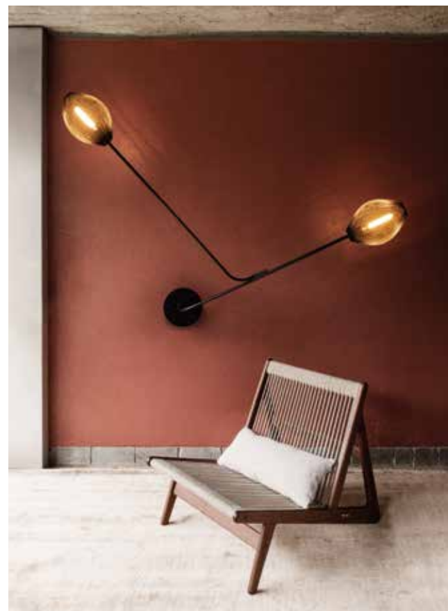
GUBI, Satellite, design by Mathieu Matégot - gubi.com