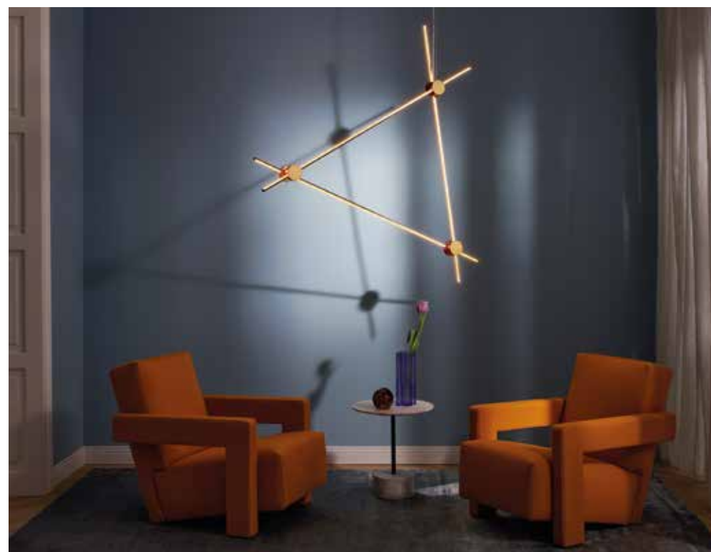
CASSINA, Eitie, design by Tobia Scarpa © Paola Pansini - cassina.com

At times graphic, at others quite simply spectacular, they hang on the walls like works of art in their own right. Under the spotlight, their assertive personalities are a world apart from the pale variations on well-known models. They also sometimes give rise to a novel lighting system, resulting in a surprising visual impact: lines of light, linked to circular connections, are transformed into hanging, floor or table lamps. ▷