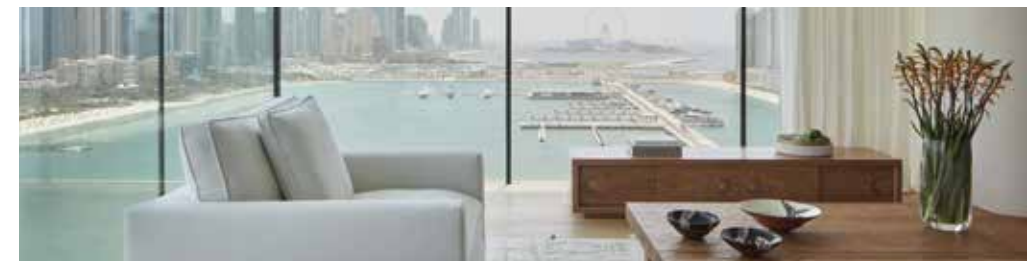
Seaside oasis Dubai, United Arab Emirates