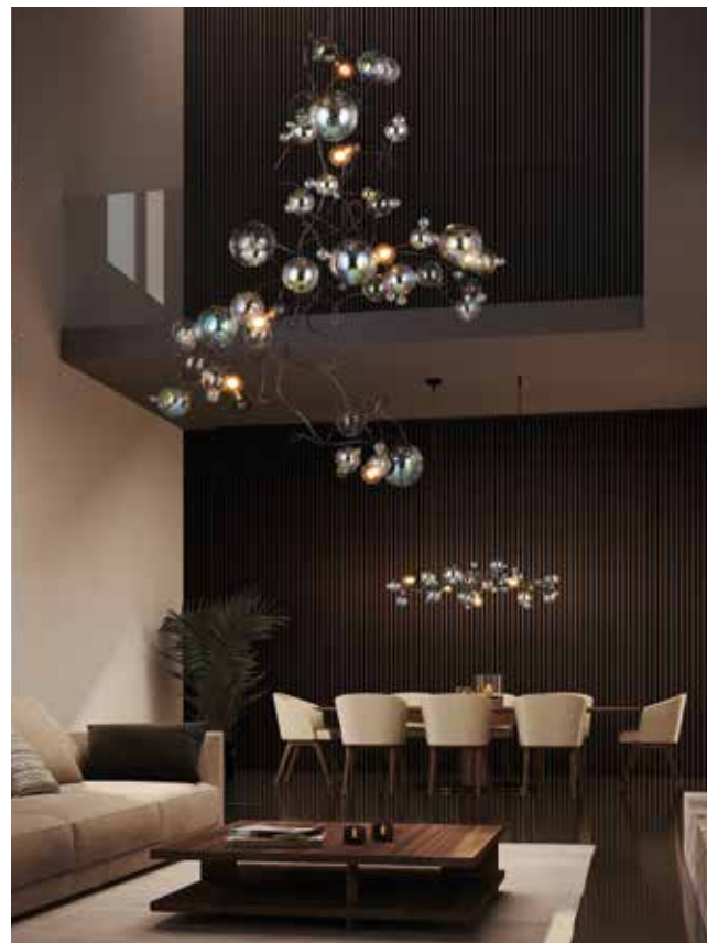
BRAND VAN EGMOND, Bubbles Swirl, design by William Brand brandvanegmond.com and studiodutchdelight.com