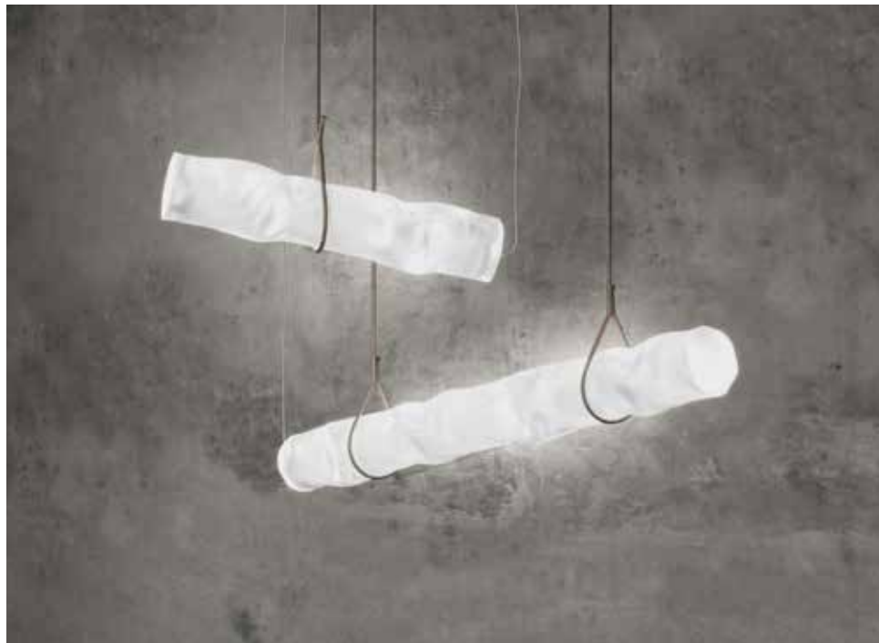
CONTARDI, Baggy, design by Paola Navone, Otto Studio - contardi-italia.it

The poetic suspensions are composed of celestial bouquets and beams. Vertical or horizontal cylinders, available in any combination of numbers, conduct the light from one end to the other, not only emitting it through each termination, but also producing it from the edge of each element to project it across the entire surface of the lamp. When only one element is working, the others relay the light by refraction and prism, making it an ingenious way to save energy. ▶