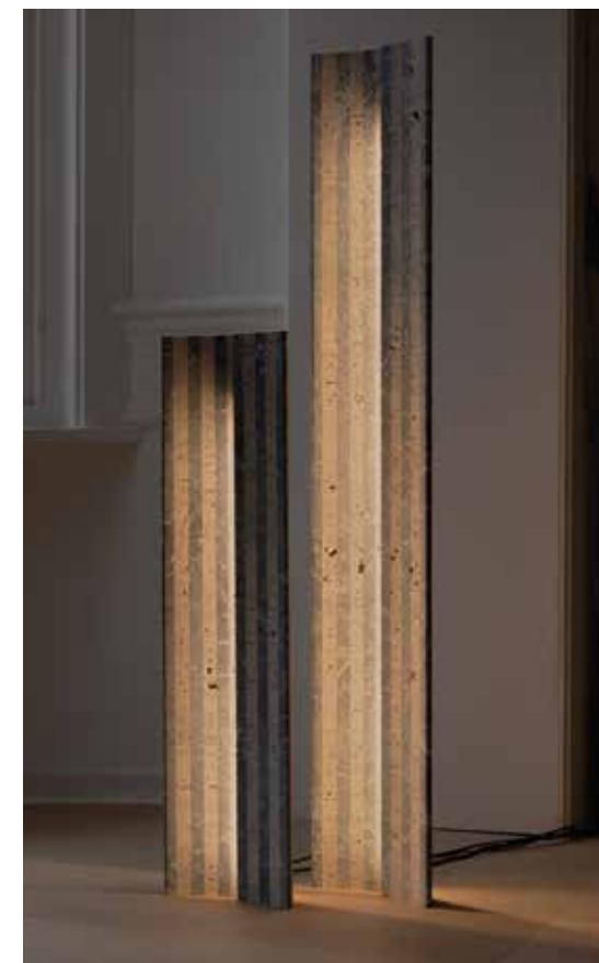
CLAISSE ARCHITECTURE, Moon Light, design by Olivier Vitry claisse-architecture.be, lebeauauneadresse.com