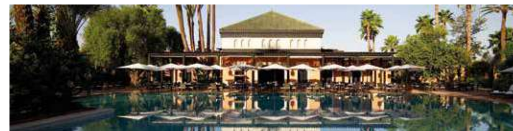
Marrakesh / Dubai Middle East