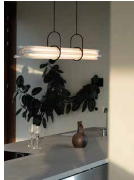
DCW EDITIONS, NL12, design by Sébastien Summa dcw-editions.fr