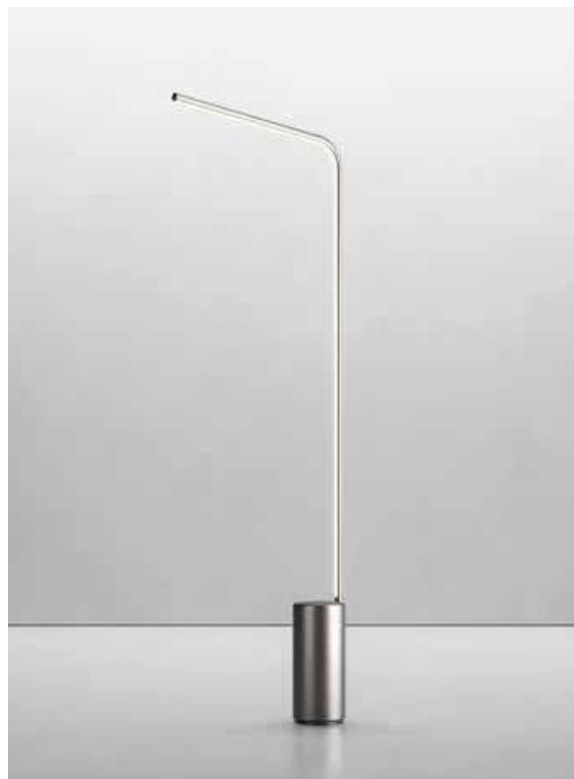
ARTEMIDE, Veil, design by Big - artemide.com

In order to adapt to today's lifestyles, hanging lamps can now be connected to power strips and hooked onto a rail to allow easy positioning and movement. Marble and travertine waste, assembled in superimposed layers, make up the delicately curved column of a floor lamp. A sheet of metal with precise folds in combination with a light manage to convey the gesture of a hand protecting the flame of a candle. The lights swathe our activities in a compassionate and soothing glow. ▷