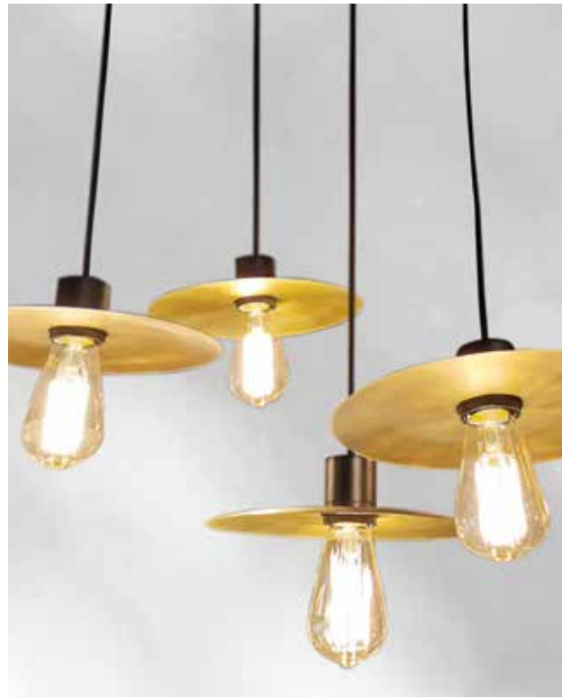
STEPHANE DAVIDTS, Ballow - davidts.com

Une brassée d'ampoules, enchâssées dans des disques en laiton, déploie son charme nostalgique. Une source lumineuse façon boule de feu (brevet « Fire Ball ») flotte dans un diffuseur en verre brillant, offrant une lumière non éblouissante. Elle se décline, en plafonnier, suspension, applique et lampe de table. Une cascade éthérée de bulles translucides et irisées nous rappelle quelques souvenirs d'enfance. Quelle que soit l'inspiration, la magie opère !