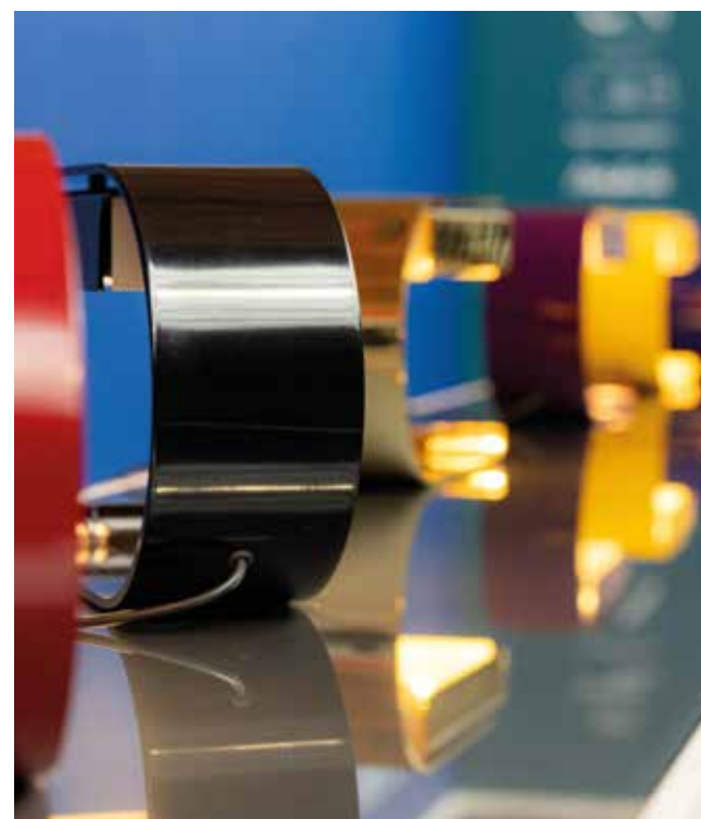
Lampes CG01 By Christophe Gevers, revisited by Caroline Notte