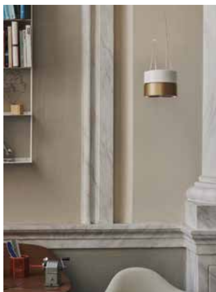
IGUZZINI, BeTwo, design by Alfonso Femia-AF Design © Paolo Carlini - iguzzini.com