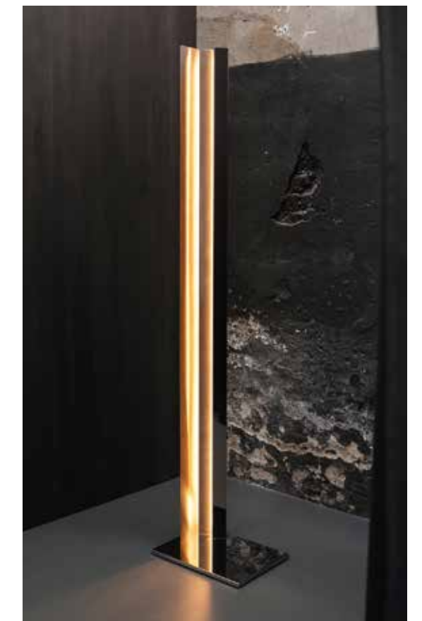
TACCHINI, Mano Light, design by Umberto Bellardi Ricci