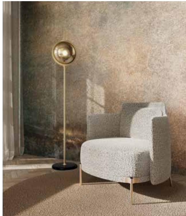
LASVIT, Polaris, Constellation collection, design by Studio Rockwell Group lasvit.com