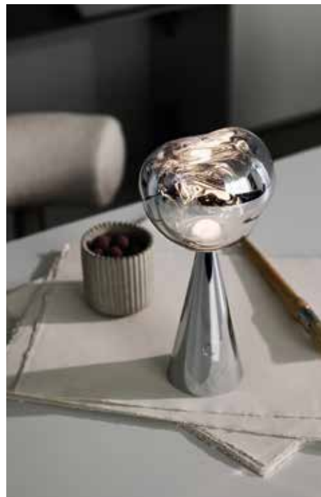
TOM DIXON, Melt Portable Silver LED - tomixon.net